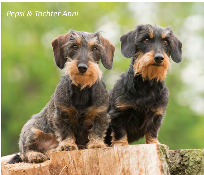
Pepsi & Tochter Anni

Und als Pepsi nach wenigen Minuten - während ich Anni fotografierte - auf meinen Schoß krabbelte und es sich dort gemütlich machte, war es ganz um mich geschehen.